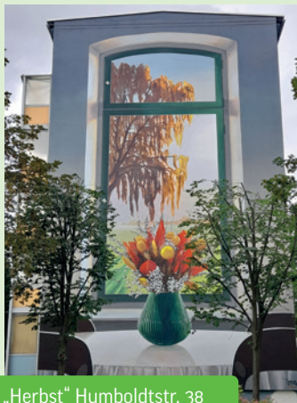
„Herbst“ Humboldtstr. 38

Die Vorbereitungen für die komplexe Sanierung des Bahnhofsgebäudes und die fortschreitenden Arbeiten an der neuen Jugendherberge sind in Gotha in aller Munde. Aber wir investieren darüber hinaus auch in unsere Gebäudebestände. Die Baugesellschaft Gotha mbH besitzt über 4.000 Wohnungen, zudem Gewerbeeinheiten, Garagen, PKW-Stellplätze, Pachtflächen und Gärten. Diese zu bewirtschaften und instand zu halten, ist unsere Kernaufgabe. Das zeigt sich an unserem Angebot von bezahlbaren Wohnungen, unseren Investitionen in Energieeffizienz und Nachhaltigkeit unserer Gebäude sowie in der steten Aufwertung unserer Wohnumfelder.